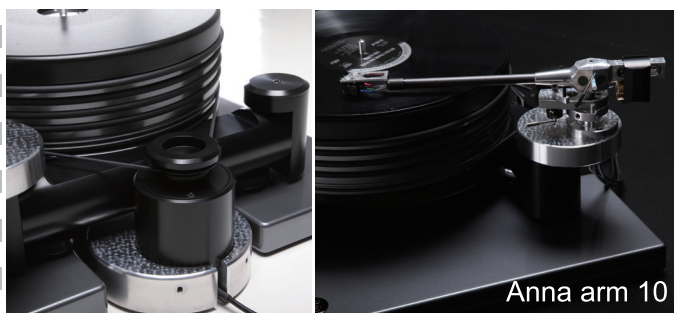
Anna arm 10