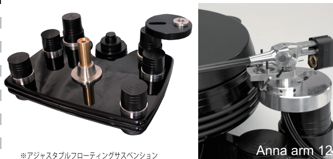
※アジャスタブルフローティングサスペンション